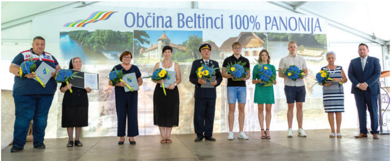
Letošnji prejemniki županovih priznanj, priznanja Občine Beltinci ter letošnji naujspešnejši maturanti