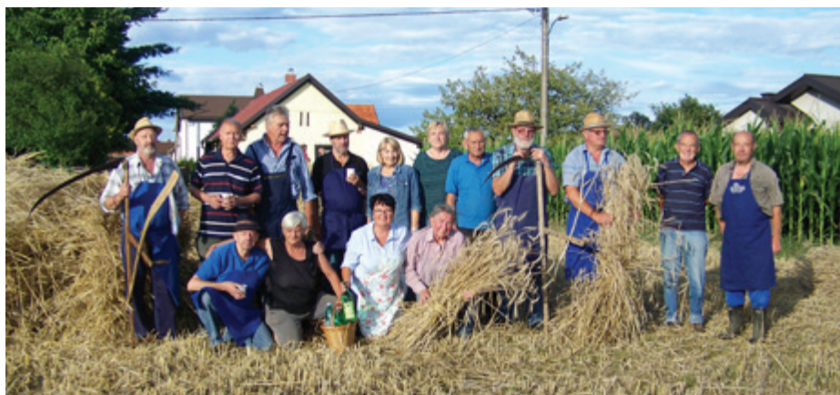
Na njivi, posejani z ržjo, so zapele kose in srpi