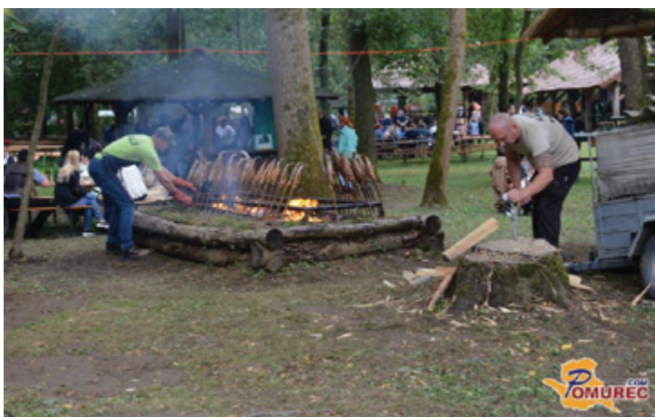
Utrinek iz tradicionalnih Bújraških dnevov v Ižakovcih