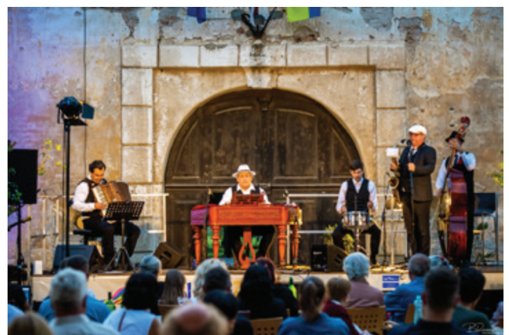
Prašnati so tokrat zaigrali pred pročeljem beltinskega gradu in navdušili občinstvo od blizu in daleč