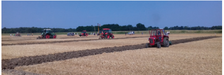
Orači so se pomerili v oranju na strnišču na polju skupine Panvita v Beltincih