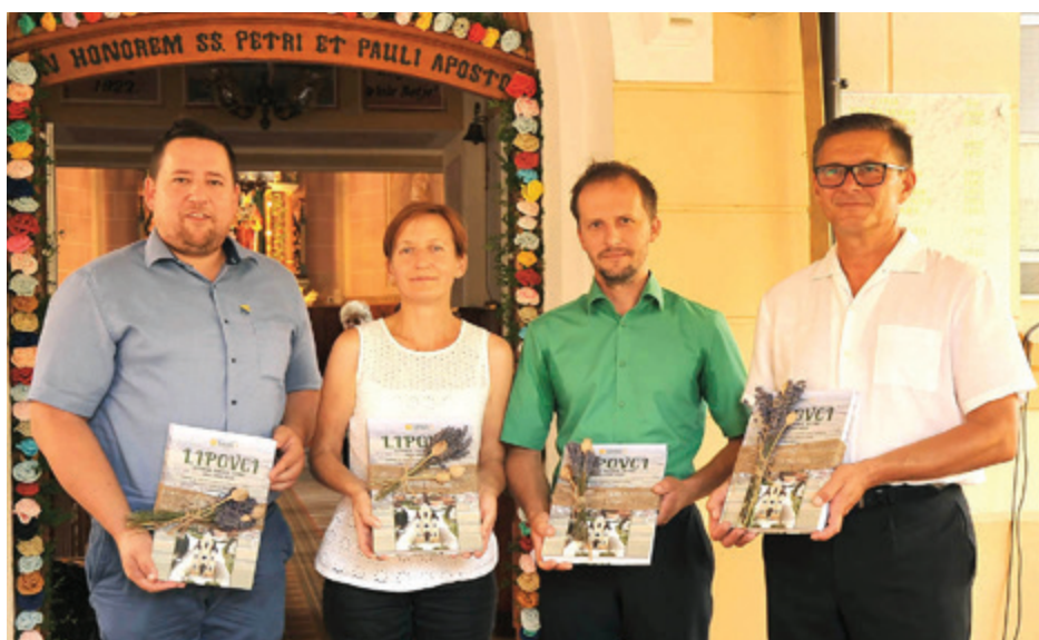
Ponosni in hvaležni