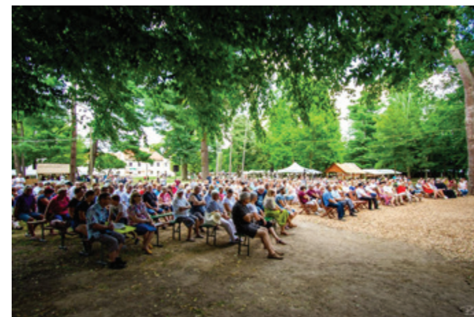
Letošnji zlati festival lepo obiskan