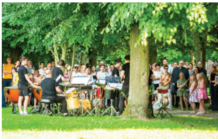
Koncert Glasbene šole Beltinci ob dnevu državnosti v beltinskem parku