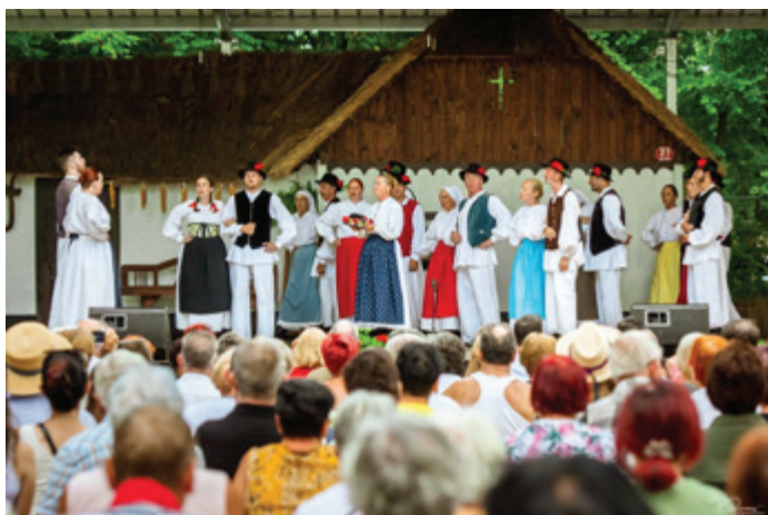
FS KUD Beltinci