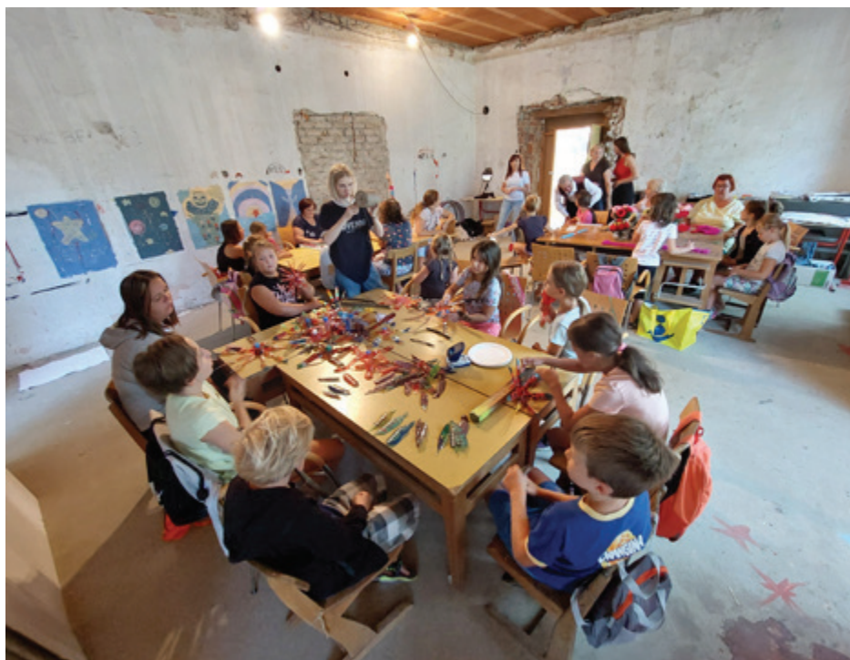
Na kreativnem taboru so številni gostujoči mentorji otroke spodbudili k ustvarjalnosti in jim pomagali do novih spoznanj in znanj

Otroci so reciklirali in izdelovali mandale iz odpadnega tekstilnega blaga, katero nam je doniralo podjetje Saubermacher Komunala, nekaj