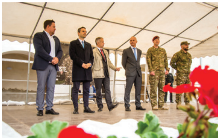
Utrinka iz 16. tradicionalne rekrutacije v Beltincih (letniki 2004, 2003 in 2002)