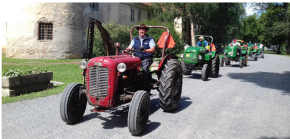
Popeljali so se s svojimi »lepotci« po prekmurskih ravnici med žitnimi polji

Klub ljubiteljev stare kmetijske in ostale tehnike Pomurje je v sodelovanju z Občino Beltinci in Krajevno skupnostjo Beltinci, Zavarovalnico Maribor in ostalimi sponzorji ter donatorji v soboto, 25. junija, na dan državnega praznika, pripravil sedmo mednarodno panoramsko vožnjo starodobnikov Prekmurja, Prlekije in Podravja, ki so se s starodobnimi traktorji, osebnimi in vojaškimi vozili popeljali po prekmurskih ravnici med žitnimi polji. Družina ljubiteljev starodobnikov se je zbrala na dvorišču beltinskega gradu, kjer so lastniki traktorjev in ostalih starodobnih vozil svoja vozila postavili na ogled. Pred začetkom panoramske vožnje sta udeležence pozdravila, se jim zahvalila za udeležbo in za ohranjanje stare kmetijske in ostale tehnike, kakor tudi dediščine naših prednikov, predsednik Kluba ljubiteljev stare kmetijske in ostale tehnike Pomurja,