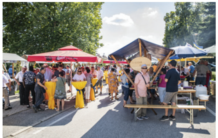
Praznično vzdušje na ULICI OKUSOV ob praznovnanju 26. občinskega praznika Občine Beltinci