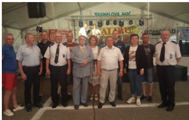
Obisk delegacije - prijateljev iz Poljske na tradicionalni Krümplovi noči v Lipi