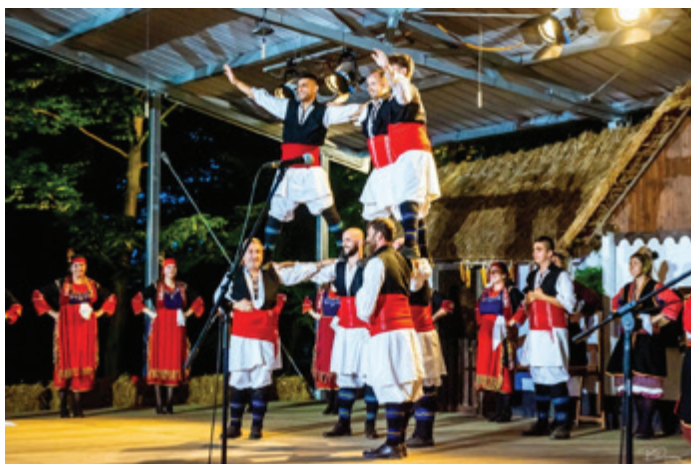
Elassona, Laografiki Archeologiki Eteria Ellassonas iz Grčije.