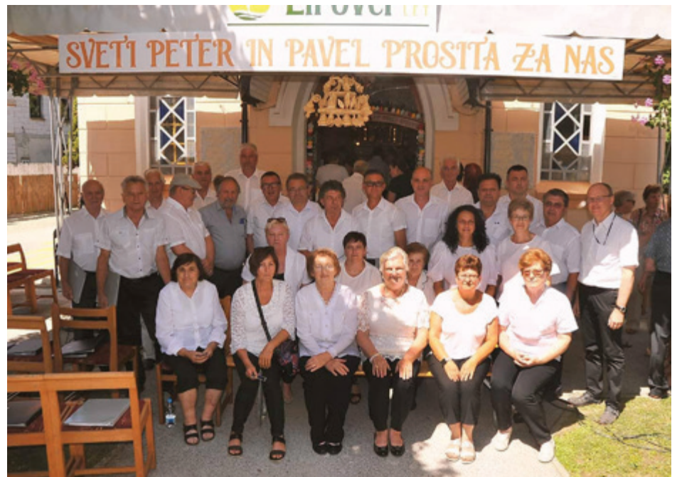
Mešani pevski zbor Lipovci

V Lipovcih so leta 1922 zgradili kapelo prav v središču vasi, blagoslovljena pa je bila naslednje leto. Tako je kapela letos stara 100 let. Skozi leta je bila deležna več obnov, zelo velika zunanja prenovitvena dela na kapeli pa so bila opravljena od leta 2016 do letos. V teh letih smo na kapeli prekrili vse tri tórne oz. zvonike z novo bakreno pločevino, montirali nova hrastova polkna na zvoniku, zamenjali strešno kritino in del ostrešja, na novo uredili strelovod, obnovili fasado - vključno s freskami -, namestili nove spominske plošče, ki smo jih poleg padlih in pogrešanih med I. svetovno vojno dopolnili tudi z Lipovčarji, ki so padli ali bili pogrešani med II. svetovno vojno, preuredili prostor pod zvonikom, preurejen je bil tudi park pred in za kapelo in opravljena druga drobna dela. Strošek vsega naštetega je do konca leta 2021 znašal 52.500,00 €, pokrit pa je bil s prostovoljnimi prispevki Lipovčarjev.