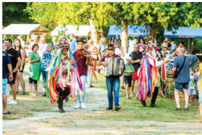
Praznično dogajanje v beltinskem parku