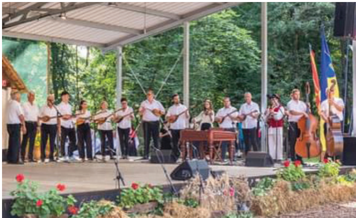
Nastop beltinskih tamburašev ob 100. obletnici tamburašev Beltinci