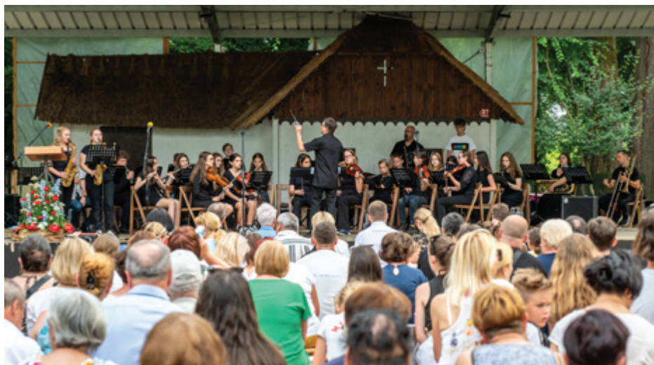
Glasbena šola Beltinci je ob dnevu državnosti pripravila izvrsten glasbeni program

Kot Slovenke in Slovenci smo se soočali z izzivi in premagovali ovire. Naša zgodovina je vezena s trdoživostjo,