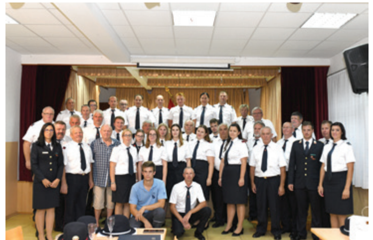
100 let PGD Lipovci, slavnostna seja ob 100. obletnici