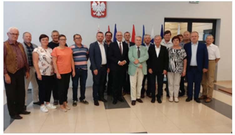
Letošnji obisk delegacije Občine Beltinci na Poljskem - v Občini Ujazd