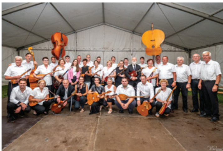
Tamburaši KUD Beltinci in Tamburaši Borovnica.

In, ker za vsakim dežjem posije sonce, je bilo tako tudi v nedeljo, 23. julija