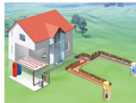
Toplotna črpalka sistema voda voda

Poleti, pri povišanih zunanjih temperaturah, se toplotna črpalka lahko uporablja za pasivno hlajenje oziroma t. i. prosto ali naravno hlajenje, pri katerem uporabimo hlad