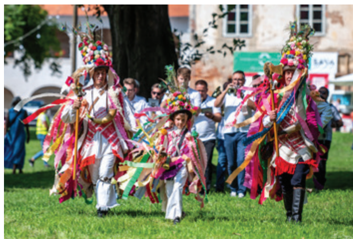
Trije pozvačini na Prazniku slovenske folklore.