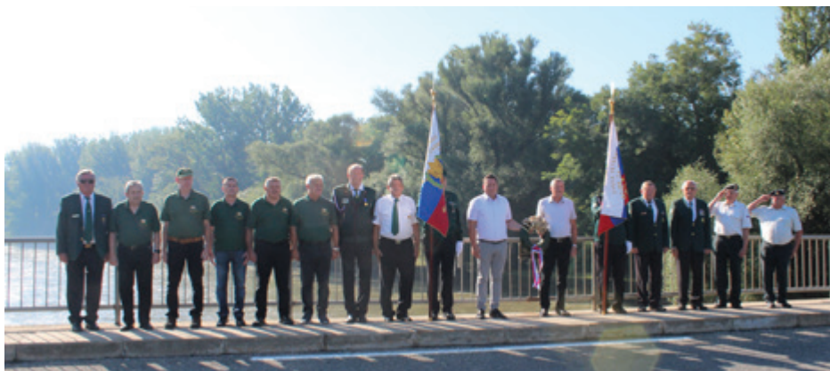
Položitev venca na mostu v Dokležovju

Slovesnost je letos potekala ob prisotnosti praporščakov vseh navedenih zvez, v ponedeljek, 14. avgusta 2023, ter ob prisotnosti obeh županov iz obeh bregov reke Mure –