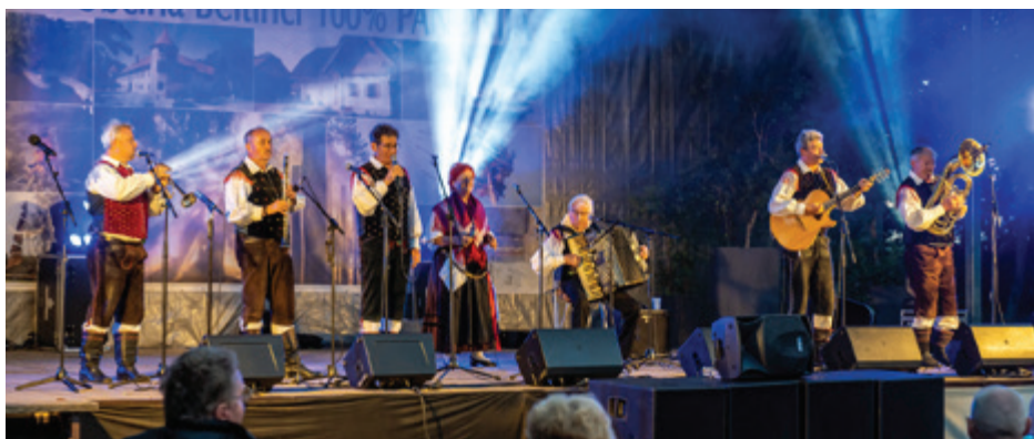
Ansambel Štirje kovači