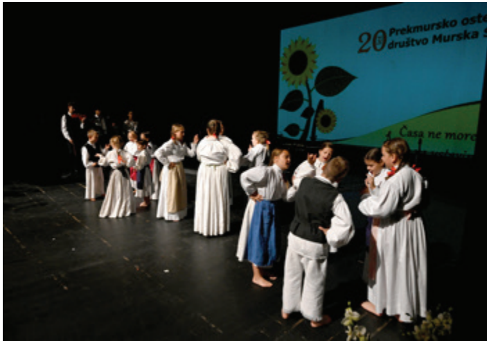
20 let Osteološkega društva Murska Sobota