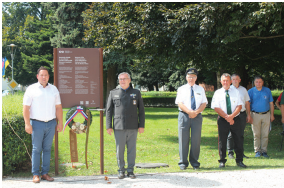
Položitev venca pri spominskem obeležju

Praznik je priložnost za razmislek o tem, da je se je slovenska narodna identiteta prekmurskega človeka ohranjala in razvijala skozi stoletja in da je k temu prispevalo takrat maloštevilno, vendar izredno trdoživo in dejavno prekmursko izobraženstvo. Prav v letošnjem letu obeležujemo 300. obletnico rojstva protestantskega pastora Štefana Kuzmiča, ki se je rodil leta 1723 v Strukovcih v Prekmurju, čigar zasluge za ohranjanje in razvoj prekmurskega jezika in kulture so