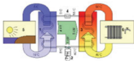
Delovanje toplotne črpalke

Toploto podtalne vode, zemlje in zraka lahko za ogrevanje izkoriščamo s toplotnimi črpalkami. Toplotne črpalke so naprave, ki izkoriščajo toploto iz okolice ter jo pretvarjajo v uporabno toploto za ogrevanje prostorov in pripravo sanitarne vode. Kateri vir bomo izbrali, je odvisno od njegove dostopnosti in gospodarnosti naložbe glede na naš objekt in njegovo lokacijo.