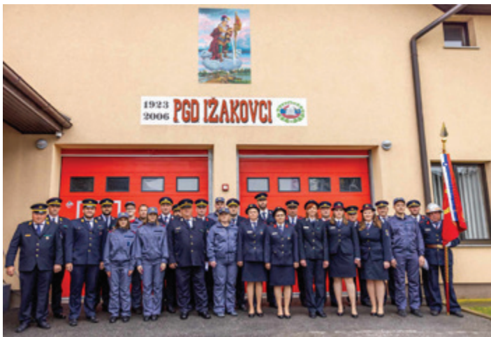
100 let PGD Ižakovci