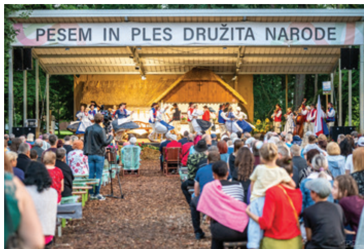
Večer tuje folklore.