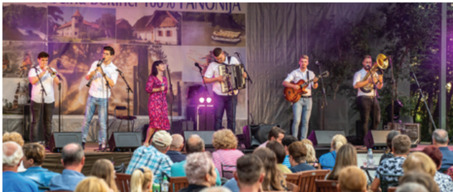
Skupina Sladki greh

Po uri in pol muziciranja so Štirje kovači koncert zaključili z legendarno Kam le čas beži. A ne sami. Z njimi je zapela domala vsa publika, ki se je v toplém poletnem večeru znašla v beltinskem parku. Množica obiskovalcev je potrdila želje mnogih po tovrstni muziki sredi Beltincev in med tem, ko so nekateri