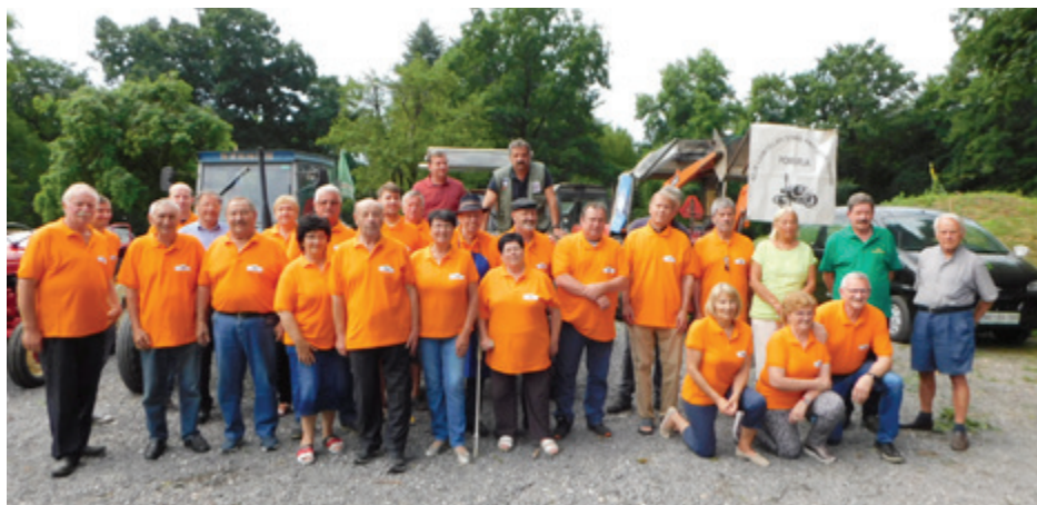
Člani kluba so svečani obeležili 20-letnico delovanja kluba

Organizirajo razstave, predstavitve, izlete in druge dogodke, ki omogočajo članom in drugim ljubiteljem, da delijo svoje znanje in strast do tehničnih dosežkov preteklosti.