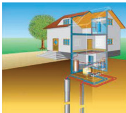
Toplotna črpalka tipa zemlja voda, z geosondo

Ogrevanje s toplotno črpalko je primerno za objekte, ki imajo površinsko ogrevanje, talno, stensko ali stropno, saj je temperatura medija na izhodu iz toplotne črpalke med