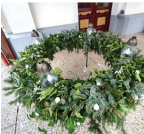
Krajevna skupnost Melinci