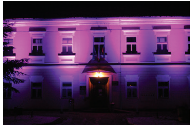
Osvetlitev občinske stavbe v vijolično, 3. 12. 2023 - Mednarodni dan invalidov