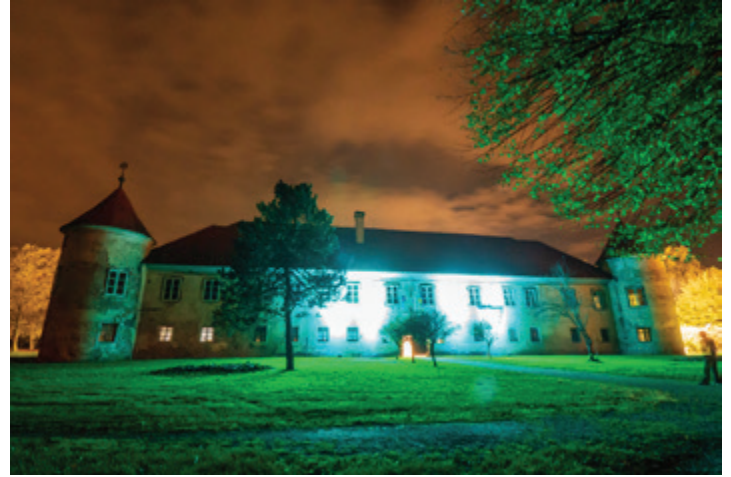
Osvetlitev gradu v turkizno, 16. 11. 2023 - Svetovni dan aktivnosti za odpravo raka materničnega vratu