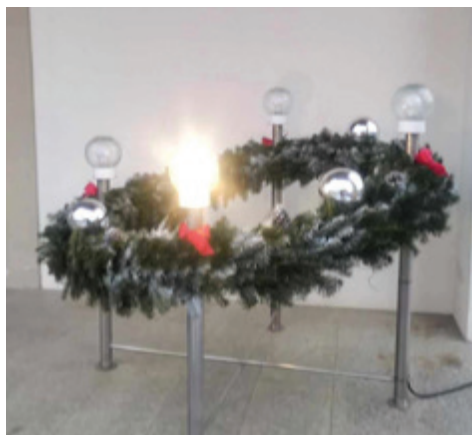
Krajevna skupnost Bratanci