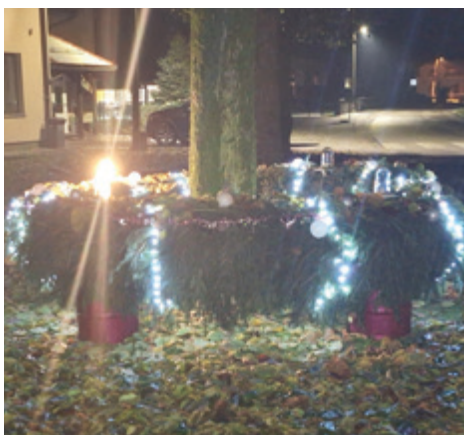
Krajevna skupnost Ižakovci