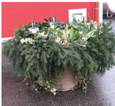
Krajevna skupnost Gančani