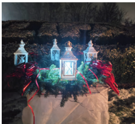
Krajevna skupnost Lipa