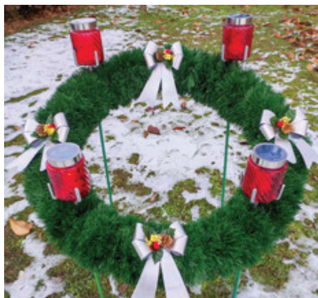
Krajevna skupnost Dokležovje