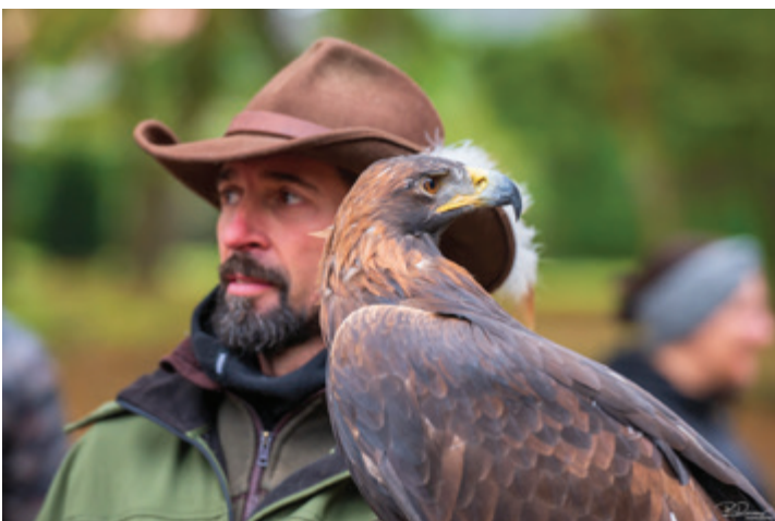
XIV. svečano odprtje lova s sokoli v Pomurju