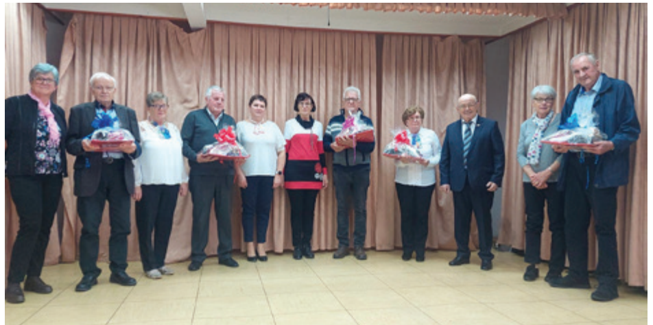
Pari, ki letos praznujejo zlato poroko, s predsednico KS Lipovci