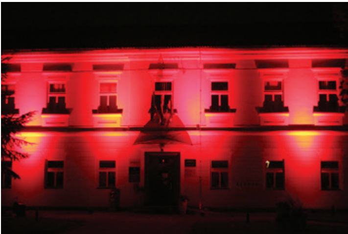
Osvetlitev občinske stavbe v temno rdečo, 1. 12. 2023 - Svetovni dan boja proti aidsu