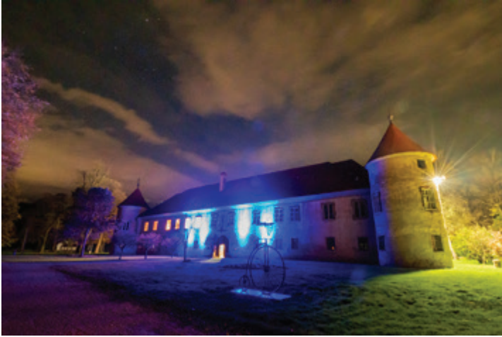
Osvetlitev gradu v modro, 14. 11. 2023 - Svetovni dan sladkorne bolezni